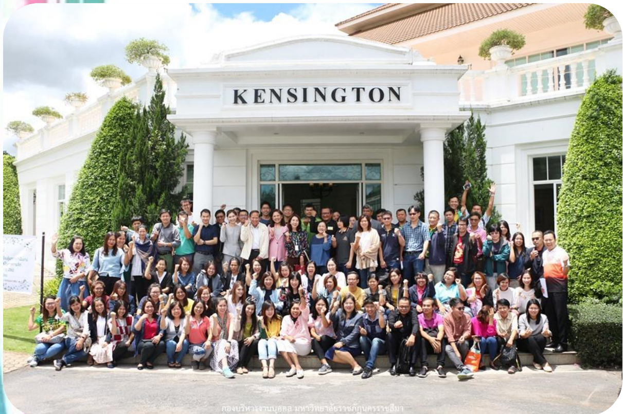
กองบริหารงานบุคคล มหาวิทยาลัยราชภัฏนครราชสีมา

ในระหว่างวันที่ 26 - 28 สิงหาคม พ.ศ. 2562 ณ โรงแรมเคนซิงตัน อิงลิช การ์เด็น รีสอร์ท เขาใหญ่ อำเภอปากช่อง จังหวัดนครราชสีมา